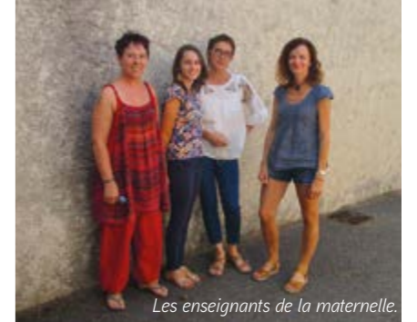
Les enseignants de la maternelle.

La période des vacances a permis d'effectuer quelques travaux dans les écoles, notamment des jeux peints au pochoirs dans la cour, à la demande des enseignants.