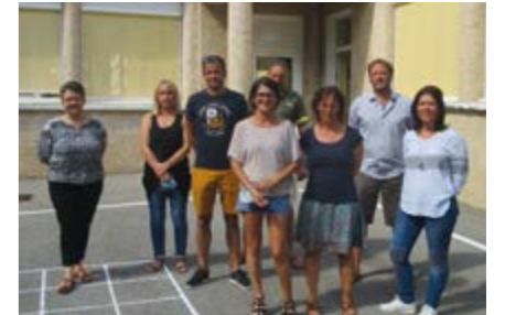
Les enseignants de l'élémentaire.