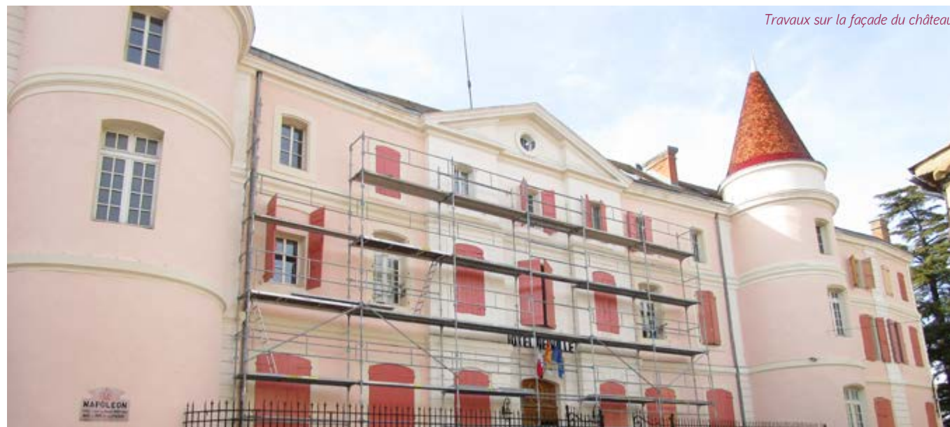
Travaux sur la façade du château