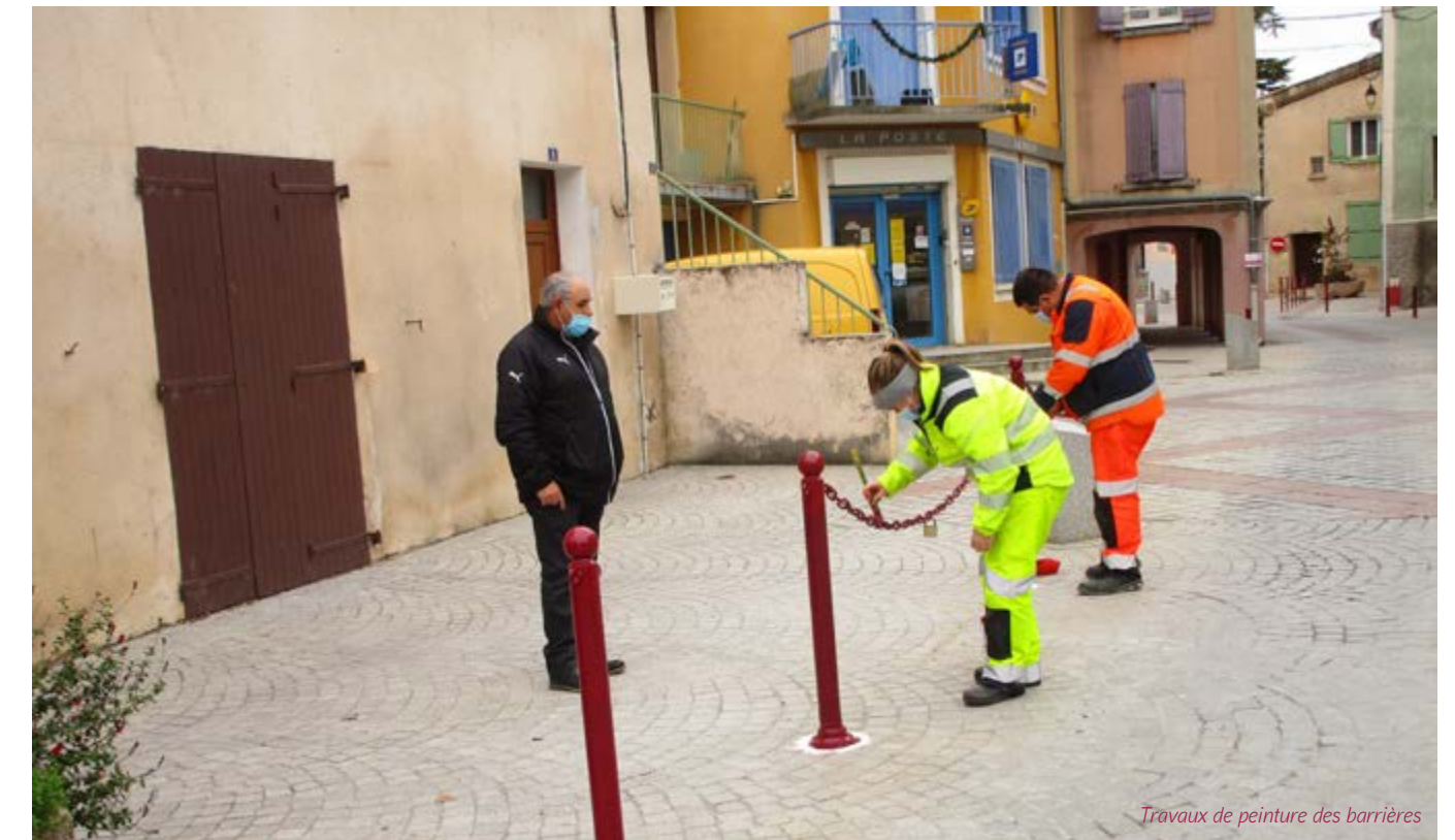
Travaux de peinture des barrières