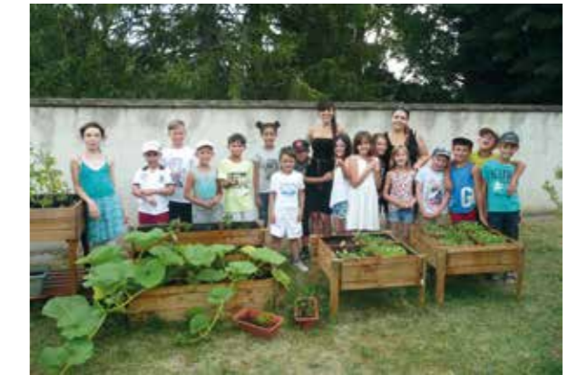
Les enfants des TAP au jardin pédagogique

En signant une convention avec le ministère de l'écologie, du développement Durable et de l'Energie, la commune de Malijai est devenue un Territoire à Énergie Positive pour la Croissance Verte (TEPCV)