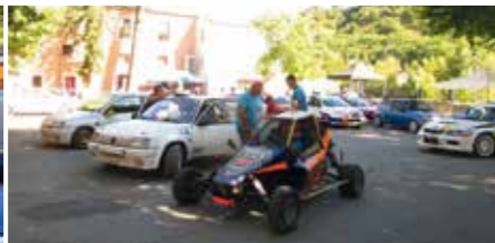
Fête du sport auto