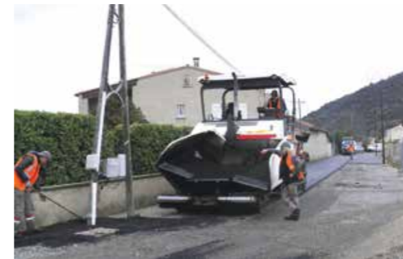
Chemin de la Tarrique

Ce chemin qui est de plus en plus fréquenté car desservant de nouveaux quartiers, a été complètement refait à neuf, son état en avait bien besoin. Les travaux ont été réalisés en deux tranches. La première a consisté à l'enfouissement de tous les câbles aériens (éclairage public, PTT, alimentation des maisons). La deuxième a consisté en l'élargissement de la route, à la réfection du canal d'arrosage et finalement à son goudronnage et son marquage au sol. L'ensemble des travaux a été suivi par l'entreprise EMS basée à Malijai à quelques mètres de là et les travaux ont été effectués par les entreprises URBELEC et EIFFAGE.