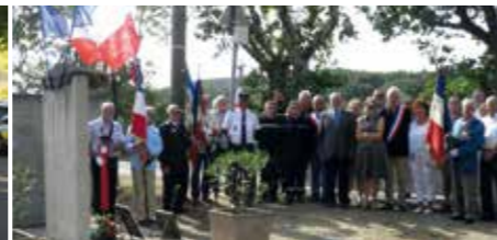
Commémoration à la stèle des fusillés

Le samedi 25 dès 10h du matin, et en continu tout au long de la journée sont prévues de multiples animations : foot, boules, simulateur de pêche, vélo supersonique, danses de salon, marche nordique, baptêmes de voiture, ainsi qu'un repas grillades à midi dans le parc du château.