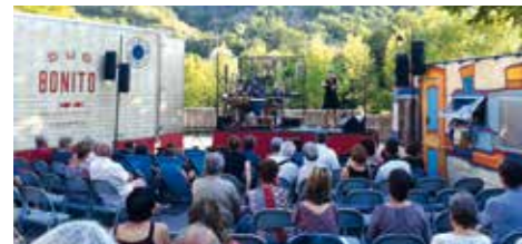
Spectacle de rue en partenariat avec le Théâtre Durance

Durant tout l'été, le village a vécu aux rythmes des nombreuses manifestations (fête du pain, du sport automobile, de la musique, fête votive, spectacle de danse, concours de boules, tournois de tennis et de tarot, soirée des donateurs du sang, kermesse, salon du Bien-Être) et des brocantes. Un grand merci à toutes les associations pour ces moments de réussite et de plaisirs.