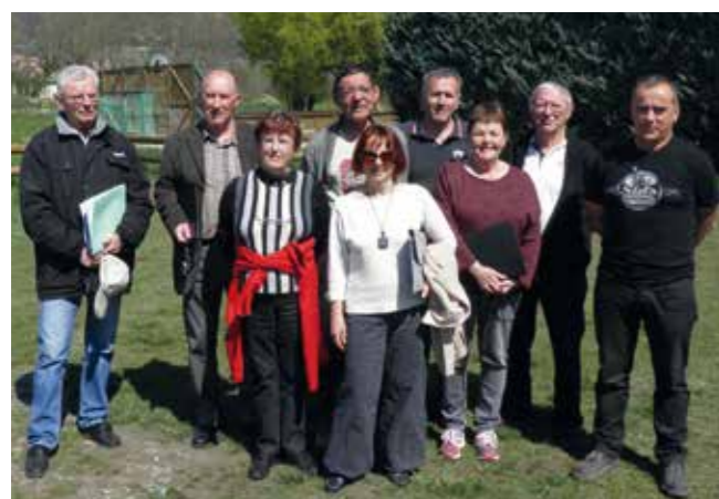
Les membres de Conseil des Sages

Dans le cadre de nos idées de campagne et de la démocratie participative, un Conseil des sages a été mis en place. Il permettra d'avoir des échanges constructifs sur nos avant-projets.